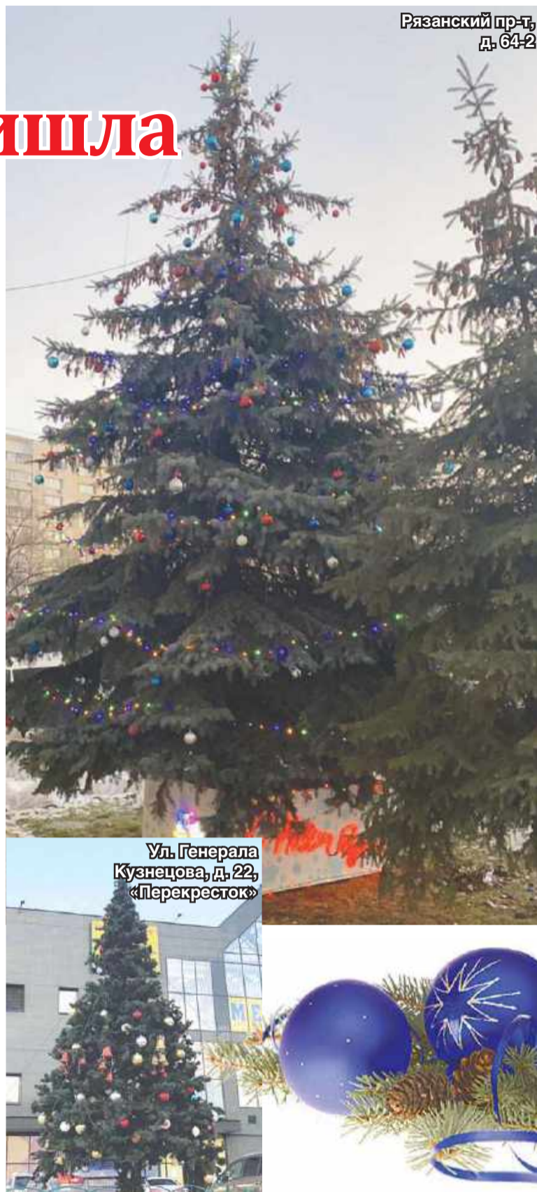
Рязанский пр-т, д. 64-2