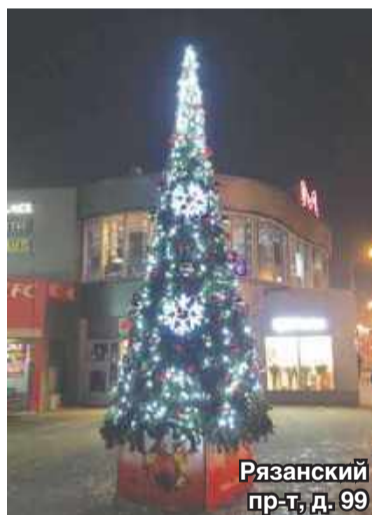
Рязанский пр-т, д. 99