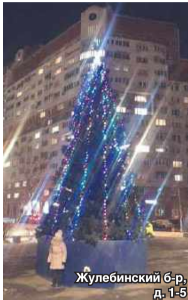
Жулебинский б-р, д. 1-5