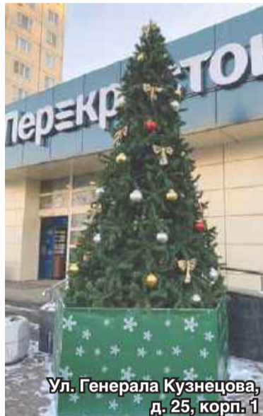
Ул. Генерала Кузнецова, д. 25, корп. 1