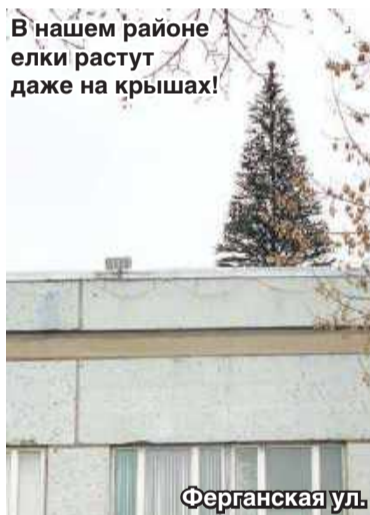
В нашем районе елки растут даже на крышах!