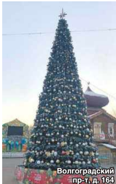
Волгоградский пр-т, д. 164