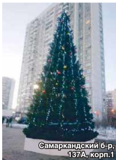
Самаркандский б-р, 137А, корп. 1